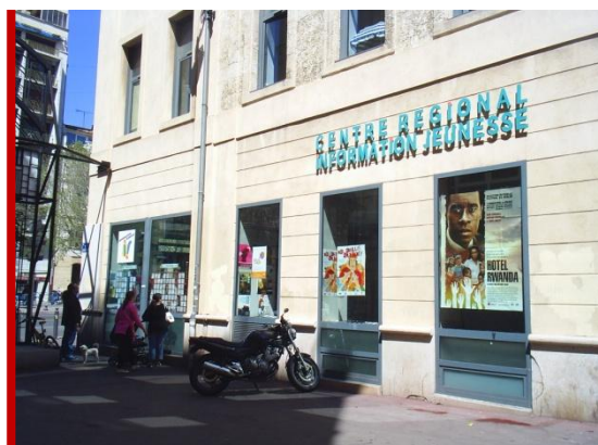
Les locaux du CRIJ abritent la Maison de l'Étudiant. Ils sont situés au 96, la Canebière, à deux pas de la fac de droit et du lycée Thiers, et à dix minutes des sites Colbert et Saint-Charles.

Le CRIJ Provence-Alpes développe et anime